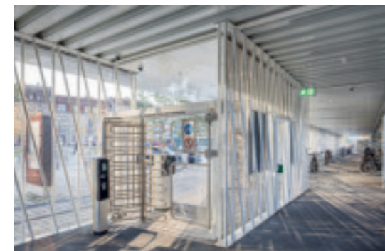
Hell, offen und geschützt: Neben Stellplätzen für Fahrrad- und Lastenrädern verfügt der Speicher über Schließfächer, einen Reparaturbereich und Ladestationen. Grundriss im Maßstab 1:750

Neben den statischen Herausforderungen mit dem Wunsch von Leichtigkeit und der gestalterischen Idee mit den Fahrradspeichen musste der Bau auch die Einbruchssicherheit gewährleisten. Anforderungen wie Überwachungskameras, Taubenvergrämung, Fluchttüren und Technikflächen wurden genauso dezent integriert wie Schließsystem und Ticketautomaten. Aufgrund von Sicherheitsbedenken seitens des Bauherrn ist aber das ursprünglich vorgesehene kosten-