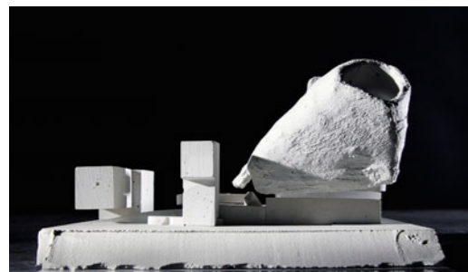
Projekte von Stiefel Kramer: „Memento Mori“, ein Theater für Tragödien, „Promenade médiale“, Wettbewerbsentwurf für das Kunsthaus Graz (unten).