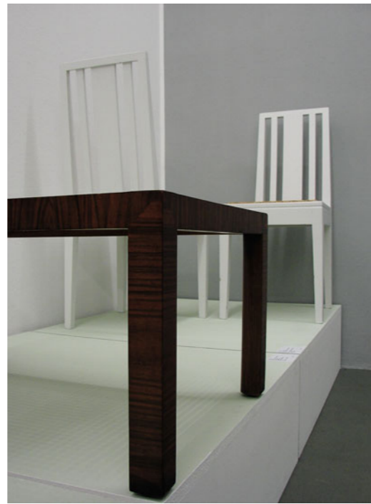
Die beiden weißen Stühle entstammen einem Typenmöbelprogramm, das Paul 1908 für die „Vereinigten Werkstätten für Kunst im Handwerk“ in München entwarf. Vorne eine Palisander-Sitzbank mit Rohrgeflecht, um 1931.