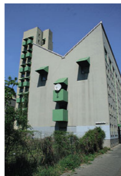
John Hejduks weltbekannte „Kreuzberg Towers“, entstanden 1988 für die Berliner IBA, haben vor einiger Zeit den Besitzer gewechselt. Jetzt erreichte uns aus Arizona der nebenstehende, an den Investor gerichtete Brief. Die drei Farbfotos zeigen die originale Farbgebung, die Ausschreibung in ImmoScout-24 die nach der Sanierung vorgesehene.

Mietangebot Website: ImmobilienScout 24